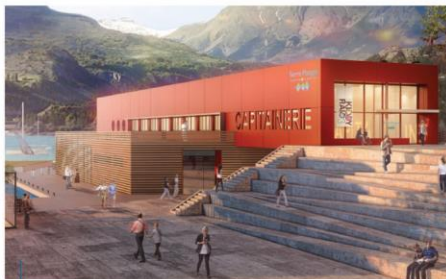
Le bâtiment présente une « forme radicale, claire, massive et légère à la fois, dynamique et contemporaine, un monolithe aux volumes géométriques », selon Anne Lévy.

et d'obtenir des informations sur le lac. L'objectif difficilement avouable, c'est de les faire rapidement repartir du bâtiment pour aller consommer le territoire, s'adonner à des activités nautiques, cheminer sur la zone du Liou et pourquoi pas sur les radeaux flottants végétalisés qui servent de frayères. On l'imagine comme un point d'entrée sur le territoire.