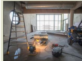
Les outils de chantier doivent être remplacés, cet été, par le nécessaire pour se détendre et se restaurer, au club-house de la capitainerie.