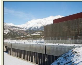
Le quai, inauguré par le ministre des Sports en septembre dernier, sera complété d'un ponton d'accueil.