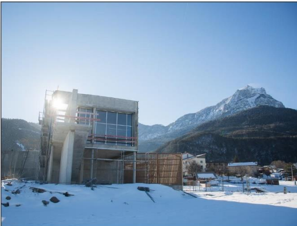
C'est un projet qui remonte, au moins, à 2010, se souvient-on au Smadesep. À l'été 2019, la capitainerie de Serre-Ponçon sera une réalité.

Après l'entrée, les bureaux, espaces de vie et salles de réunion se succèdent. Ici, ceux du Smadesep - une équipe d'une dizaine de personnes. Là, des sanitaires. « A destination des plaisanciers, mais aussi pour le public », prévient Victor Berenguel. À la fin du cheminement, en direction du lac, place à l'autre cœur du bâtiment « club house ». Là encore, l'idée est de faire de la capitainerie autant un lieu de vie qu'un outil pour plaisanciers. « On va avoir jusqu'à une quarantaine de personnes dans cet espace » où restauration et boissons sont prévues. L'appel d'offres est sur les rails pour le mois de février.