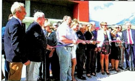
La capitainerie de Serre-Ponçon a été inaugurée, hier, en présence de nombreux élus du département.