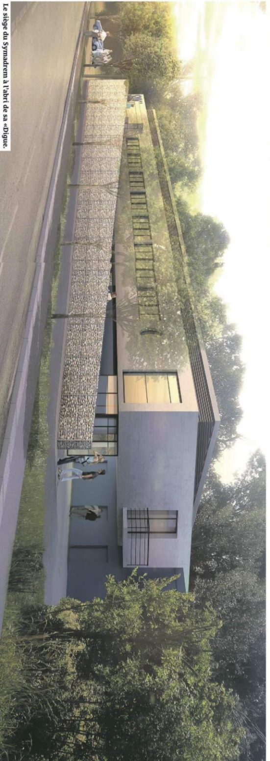
Le siège du Synamdrem à l'abri de sa «Digue».